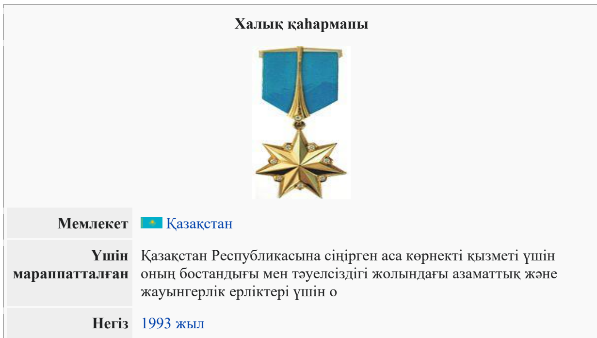
Сурет 1. Халық қаһарманы жұлдызы

ҚР Президенті Н.Ә. Назарбаевтың 1994 жылғы 23 мамырдағы №1707 Жарлығымен С.Қ. Нұрмағамбетовке «Халық Қаһарманы» атағы берілді.