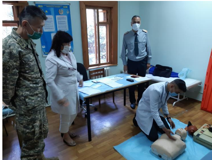
Сурет 1. Медициналық жәрдем көрсету

жөн. Теориялық бағыттағы тақырыптарды зерделеу кезінде көрнекі құралдарды қолдану, материалды әскери қызметшілердің күнделікті өмірінен мысалдармен таныстыру.